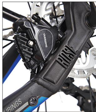
Die Bremsanlage befestigt Rose am neuen Rahmen bereits per Flatmount-Standard.

Fazit: Eher Tourer als Querfeldein-Sportler, überzeugt das Rose jeden Vielfahrer, der neben Asphalt auch gerne Schotter und Waldwege unter die Reifen nimmt. Der Rahmen ist solide, Ausstattung und Gewicht sind, gemessen am fairen Preis, top!