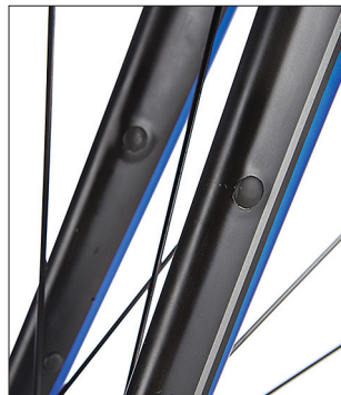
Die Befestigungsmöglichkeiten für Schutzbleche freuen alle Allwetterfahrer.