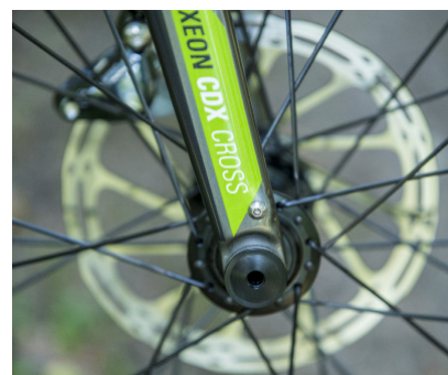
150 millimeter steekas.